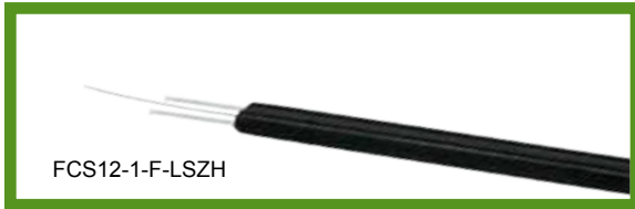
自承式蝶形室内光缆(单模,单芯)