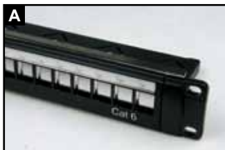
六类配线架背板示意图