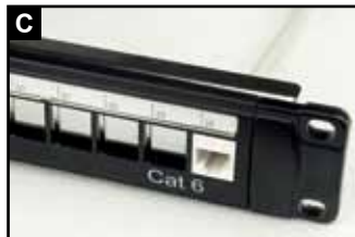
用力使模块插入背板背部卡座