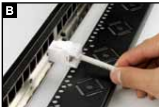
将已完成压接的模块置于背板背部