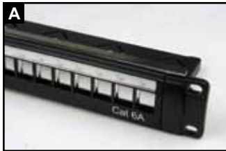
超六类配线架背板示意图