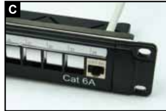
用力使模块插入背板背部卡座