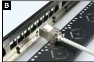
将已完成压接的模块置于背板背部