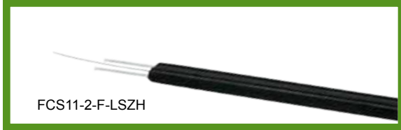
蝶形光缆 (单模, 双芯)