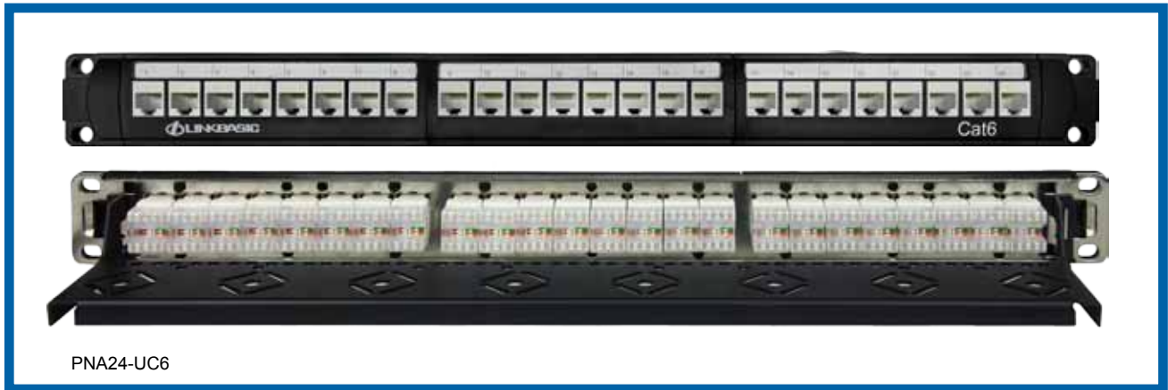
六类24口非屏蔽配线架JKA09