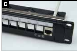
用力使模块插入背板背部卡座