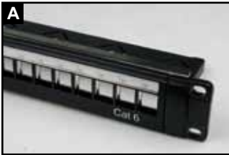
六类配线架背板示意图